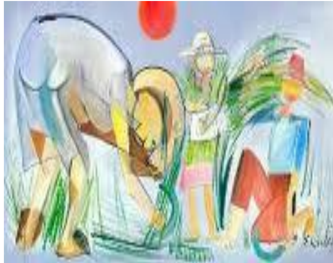
Figura 8 - Colheita, Flávio Scholles

"A DEMOCRACIA AINDA É A QUESTÃO: REFLEXÕES SOBRE A DITADURA CIVIL-MILITAR E A COMISSÃO NACIONAL DA VERDADE"