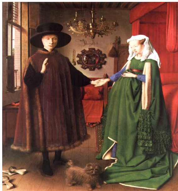
Figura 3 - Retrato de Arnolfini: Signos, e o pintor como testemunha ocular Jan Van Eyck, 1434

Os acessórios representados junto com os modelos geralmente reforçam as auto-representações. Esses acessórios podem ser considerados como 'propriedades' no sentido teatral do termo. Colunas clássicas representam as glórias da Roma Antiga, ao passo que cadeiras semelhantes a tronos conferem aos modelos uma aparência de realeza. Certos objetos simbólicos referem-se a papéis sociais específicos. [...] Algumas dessas convenções sobreviveram e foram democratizadas na era do retrato de estúdio fotográfico, a partir da metade do século 19. Camuflando as diferenças entre classes sociais, os fotógrafos ofereciam aos seus clientes o que foi chamado de 'imunidade temporária em relação à realidade'. Sejam eles pintados ou fotografados, os retratos registram não tanto a realidade social, mas de ilusões sociais, não a vida comum, mas performances especiais (BURKE, 2004, p. 32, 34, 35).