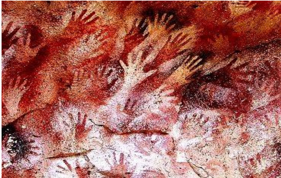
Figura 2 - Pintura na Caverna de Patagônia (Argentina)