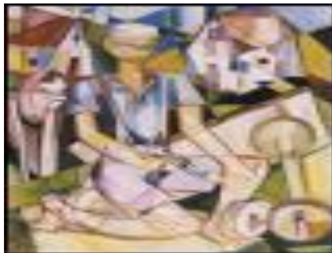
Figura 7 - Menino fazendo carrinho de lomba, Flávio Scholles

A memória de uma história local também pode estar representada e documentada através da fotografia e da pintura. Numa aula interdisciplinar de História e Arte, podemos fazer uso de fotos antigas, mas podemos também conhecer as pinturas de um artista da nossa região, que retrata os habitantes do interior em sua rotina: no trabalho na roça, nas brincadeiras de criança, nas migrações para a cidade. O artista: Flávio Scholles. Um artista que já morou em vários países do exterior, viajou o mundo inteiro, mas sua identidade está aqui, no Brasil, no Rio Grande do Sul, na região do Vale do Sinos. Ele representa a sua memória, a sua infância no meio rural, a sua partida para a cidade em busca de estudos, emprego, uma vida melhor. Mas retornou a sua origem, a sua história local.