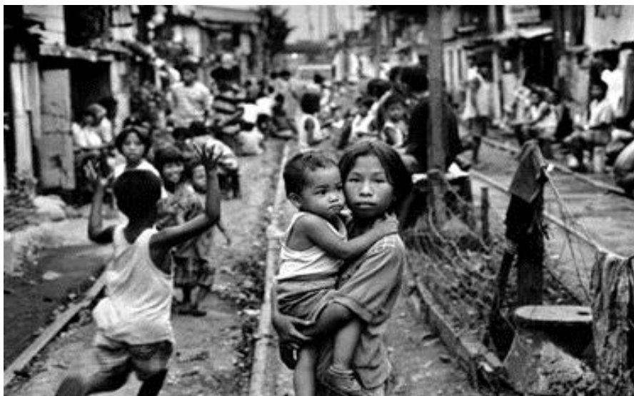
Figura 6 - Retrato de Crianças do Êxodo: Filipinas, 1999, Sebastião Salgado Fonte: Google Imagens

"A DEMOCRACIA AINDA É A QUESTÃO: REFLEXÕES SOBRE A DITADURA CIVIL-MILITAR E A COMISSÃO NACIONAL DA VERDADE"