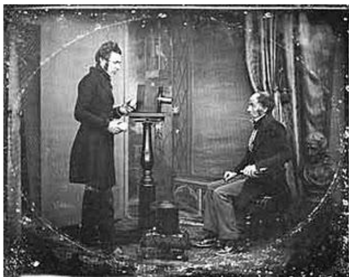
Figura 4 - Fotografia de daguerreótipo em estúdio (arte mecânica).

"A DEMOCRACIA AINDA É A QUESTÃO: REFLEXÕES SOBRE A DITADURA CIVIL-MILITAR E A COMISSÃO NACIONAL DA VERDADE"