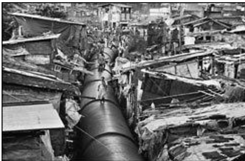
Figura 5 – O que te impressiona e sensibiliza mais? A situação ou as vítimas?

As crianças não acharam interessantes as fotos da exposição sobre crianças, ali ao lado, mas ficaram muito impressionadas com as fotos da exposição principal Êxodos . Nessa parte da exposição, o que impressionara mais? 'Tanta gente morta sem ninguém com elas,' respondeu um menino. Ele estava se referindo, provavelmente, aos massacres étnicos de Ruanda. Eis o ponto: o olhar das crianças foi golpeado pela solidão na hora da morte. Elas não sabiam, mas estavam expressando um dos valores mais fortes da nossa cultura ibero-americana: a sociabilidade comunitária da morte, a co-responsabilidade dos vivos pelo destino dos que partem para sempre. Nenhum abandono é maior, nenhuma injustiça é maior (MARTINS, 2008, p. 101).